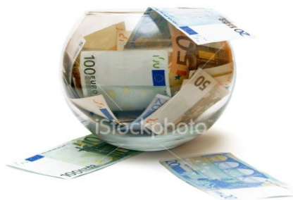
Οι Εισφορές Εργαζομένων και Εργοδοτών εκπίπτουν στο σύνολο τους φορολογικά

Τ ην 21/10/2002, η Διεύθυνση Φορολογίας Εισοδήματος του Υπουργείου Οικονομίας και Οικονομικών, σε σχετικό ερώτημα του Υπουργείου Εργασίας και Κοινωνικών Ασφαλίσεων, απα-